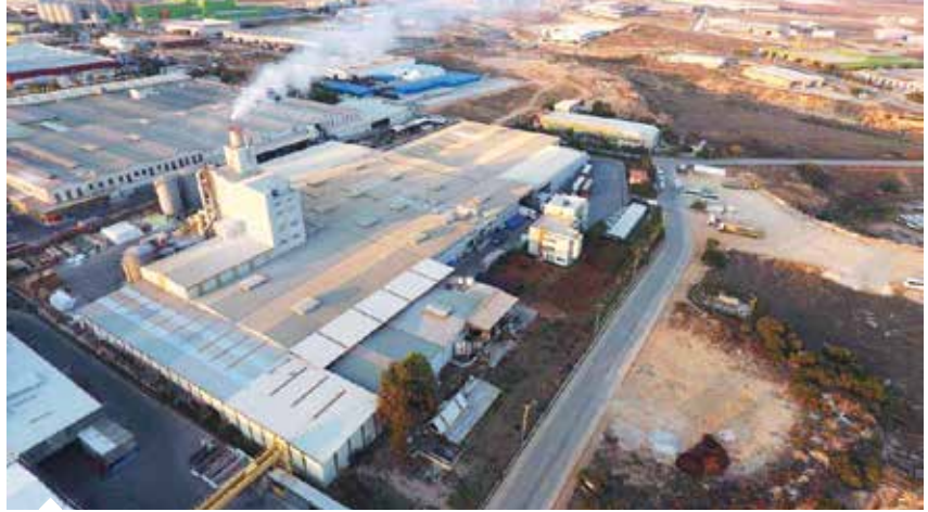
Adana merkezli Beyaz Kağıt ve Hijyenik Ürünleri Temizlik, İnşaat San. Tic. A.Ş.'nin bulaşık makinesi kapsülü üretim tesisi projesinde 657,5 milyon liralık yatırım gerçekleştirilecek.

Resmî Gazete'de yayımlanarak yürürlüğe giren Cumhurbaşkanı kararlarına göre, İzmir'de Smart Güneş Enerjisi Teknolojileri ARGE Üretim Sanayi ve Ticaret A.Ş.'nin projesinde sabit yatırım tutarı 7 milyar 627 milyon lira, ilave istihdam 2 bin 335 kişi olarak öngörülüyor. 4 yıllık yatırım süresi sonunda yılda 2 bin 48 megavat kapasiteyle fotovoltaik güneş paneli üretilmesi planlanıyor. Stratejik yatırım için projeye, KDV istisnası, gümrük vergisi muafiyeti, sigorta primi işveren hissesi, nitelikli personel ve enerji