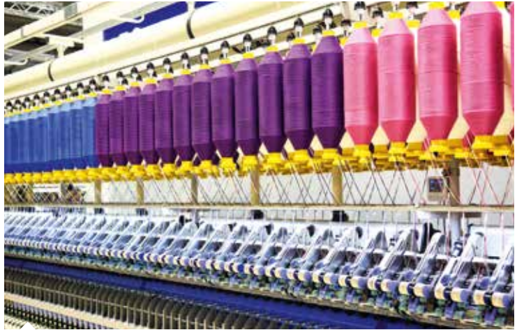
Başkan Fatih Doğan, tekstil makinelerinde yerli ve milli üretimin teşvik edilmesinin sürdürülebilir üretim açısından da kritik önem taşıdığını vurguladı.

artışla 88,6 milyon dolarlık ve İspanya'ya yüzde 57 artışla 88,4 milyon dolarlık ihracat yaptık. İhracat hacminde en yüksek değerlere ulaştığımız ülkelere baktığımızda, yüzde 2 bin 85 artış ve 3,5 milyon dolar değer ile Suudi Arabistan birinci, yüzde 538 artış ve 3,1 milyon dolar değer ile Slovakya ikinci, yüzde 480 artış ve 921 bin dolar değer ile İsviçre üçüncü sırada yer aldı."