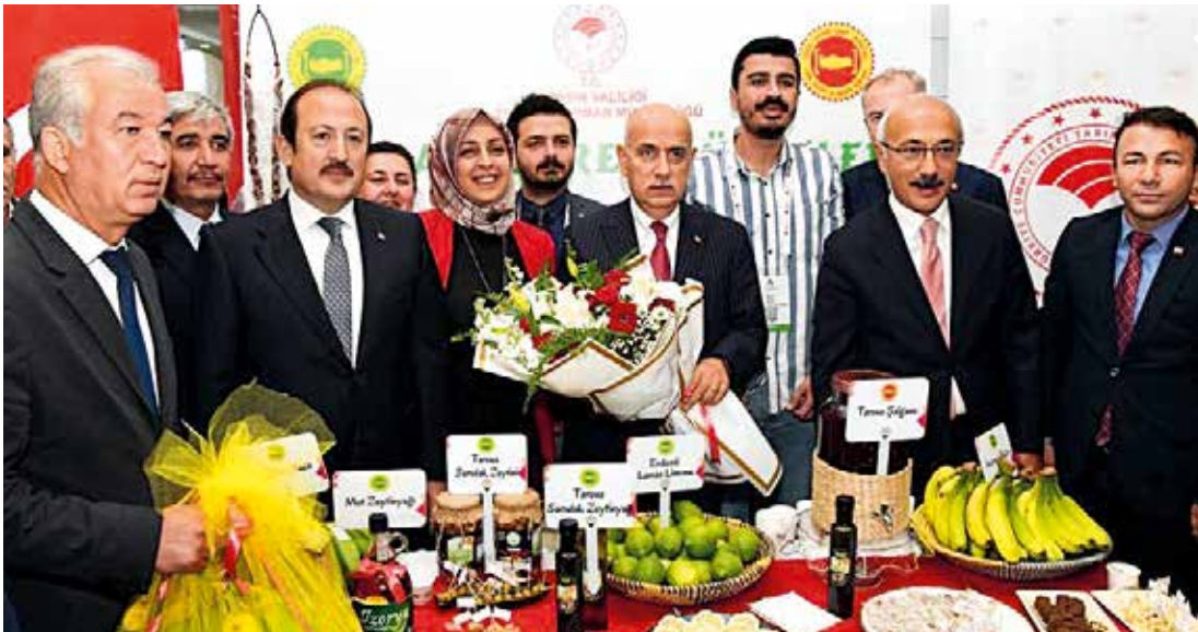
Tarım ve Orman Bakanı Prof. Dr. Vahit Kirişçi, Uluslararası Turunçgil Kongresi'nde Mersin'de yetiştirilen ürünlerin tanıtıldığı standları ziyaret etti. Bakan Kirişçi, Mersin'in turunçgil üretimindeki başarısından dolayı üretici temsilcilerini tebrik etti.