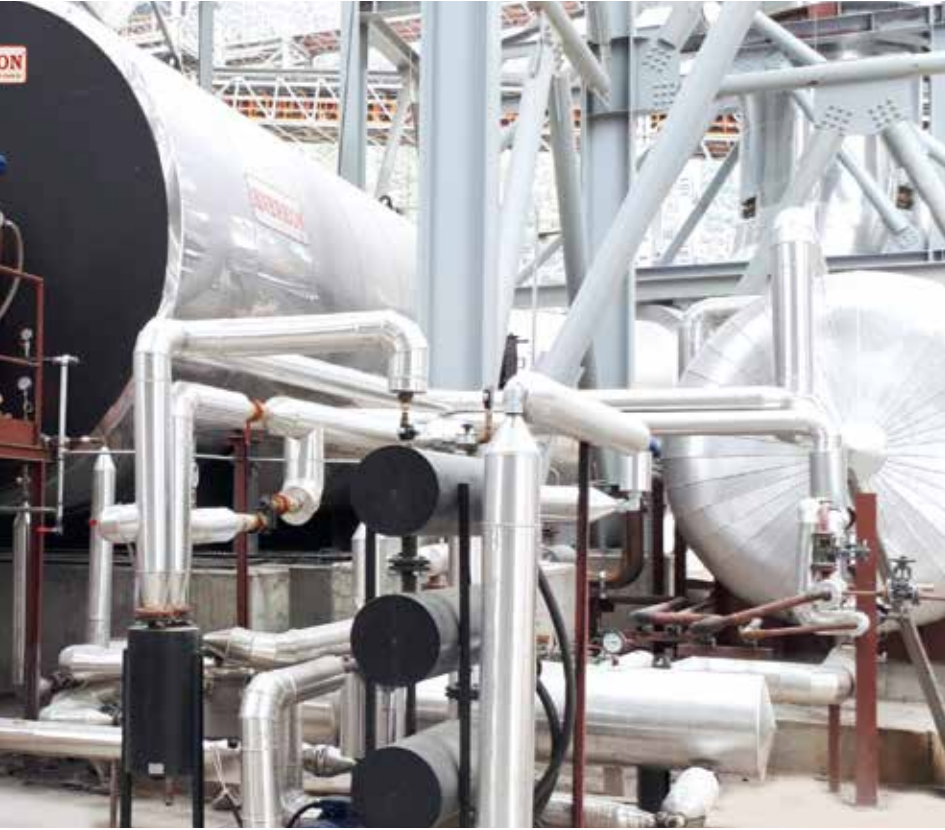
Barış Enerji, Türkiye genelinde ve uluslararası pazarlarda "Enerkon" markasıyla mühendislikteki gücünü ortaya koyuyor.

değer yaratmakla mümkün olabileceğinden yola çıkarak ülkemiz ekonomik çarklarını hızlandıracak en önemli etmenin üretim olduğunun bilinciyle yönümüzü ticaretten sanayiye doğru çevirdik. 2018 yılının sonunda açtığımız 15 bin metrekare kapalı, 5 bin metrekare açık alan olmak üzere toplamda 20 bin metrekare alanda konumlanan fabrikamızda tasarım, imalat, montaj, taahhüt, devreye alma, servis, bakım disiplinlerinin tamamını kendi