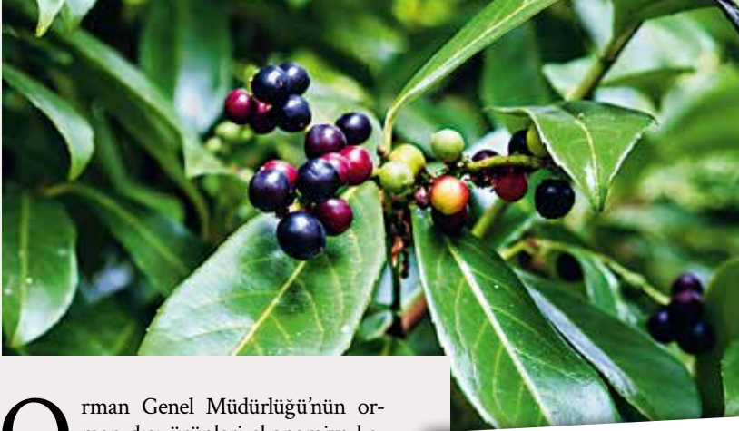
Defne ağaçlarından toplanan yaprak ve meyveler, sabundan parfüme, yemeklerden salatalara kadar pek çok alanda kullanılıyor.